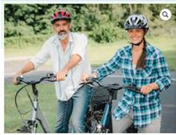
mobil & aktiv mit dem Pedelec Mehr Sicherheit – mehr Fahrspaß

Die Verkaufszahlen von Pedelecs, landläufig auch e-bike genannt, sind in den vergangenen Jahren stark angestiegen. Rund 8,5 Mio. Pedelecs sind in Deutschland unterwegs. Allein in den vergangenen drei Jahren wurden rund 2 Mio. Pedelecs pro Jahr verkauft. Die Verkaufszahlen legen