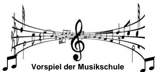
Vorspiel der Musikschule

Am Samstag, 5. April 2025 , findet im Pfarrstadel um 14 Uhr das diesjährige Vorspiel der Bihlafinger Schüler der Musikschule Gregorianum der Stadt Laupheim statt.