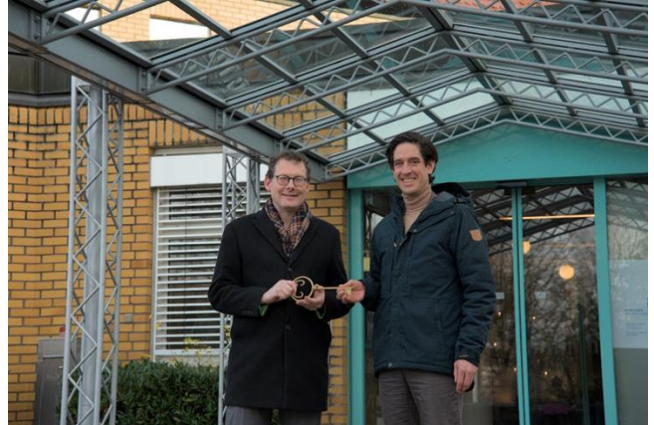
Laupheims Oberbürgermeister Ingo Bergmann und Landrat Mario Glaser bei der symbolischen Schlüsselübergabe vor dem Gebäude der ehemaligen Klinik

und die Schaffung von modernen und bürgernahen Einrichtungen. Die nächsten Schritte der Planung werden unter Einbeziehung aller relevanten Akteure erfolgen, um eine bestmögliche Nutzung des Gebäudes zu gewährleisten.