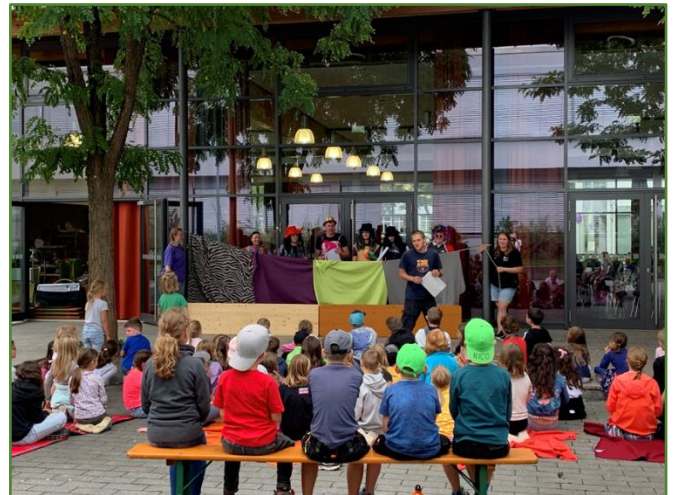
Beim Betreuertheater hatten sowohl Klein als auch Groß einen Riesenspaß.

behandelt. Dabei geht es darum, aus scheinbar nutzlosen und alten Stoffen oder Objekten, neue Produkte zu gestalten. In der zweiten Woche lautet das Motto – passend zum berühmtesten Sohn der Stadt, dem Filmpionier Carl Laemmle – „Film ab!“. Die dritte und letzte Woche nimmt die Kinder mit ins Phantasieland. Die Stadtverwaltung dankt sowohl den Kooperationspartnern als auch allen beteiligten und engagierten Mitarbeiterinnen und Mitarbeiter, die dafür sorgen, dass auch diese Sommerferien für die Kinder wieder mit spannenden Erlebnissen, sowie Spiel und Spaß verbunden sind.