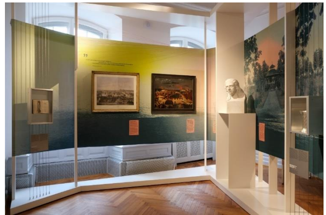
In der neuen Dauerausstellung wird die Laupheimer Geschichte unter den Aspekt des gemeinsamen Beziehungsgeflechts zwischen Christen und Juden beleuchtet.

wird Nachmittags um 15 Uhr eine weitere öffentliche Führung angeboten.