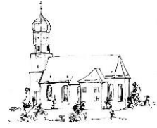
St. Georg und Sebastian Untersulmetingen