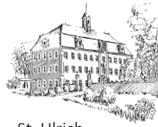
St. Ulrich Obersulmetingen